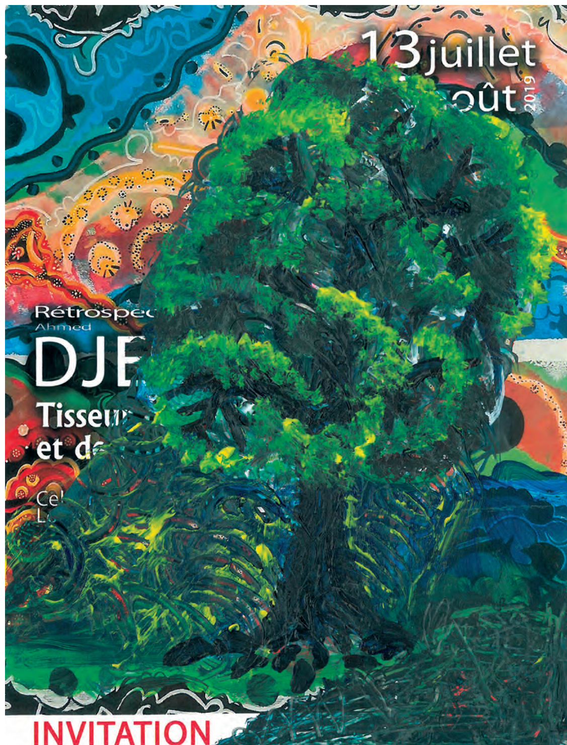
Ci-dessus l'invitation, toute personnelle d'Ahmed, peinte spécialement pour C le MAG